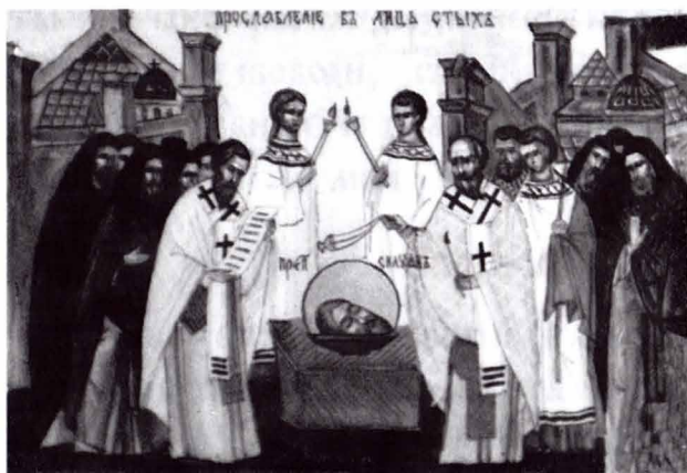
Прославление в лике святых

От Зарубежной церкви стали приезжать просители отдать главу им. Возникла опасность, что кто-нибудь из