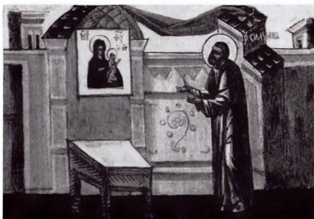
Дар непрестанной молитвы