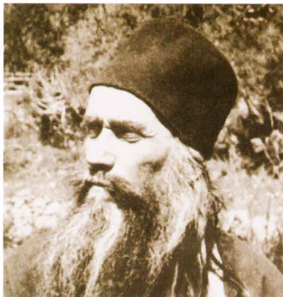
Преподобный Силуан Афонский, монах Свято-Пантелеимонова монастыря

Русский на Афоне Свято-Пантелеимонов монастырь. Здесь хранится ковчег с мощами главы преподобного Силуана Афонского