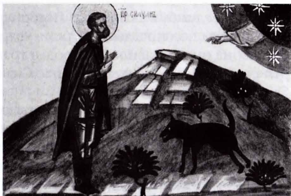
Нападение бешеной собаки

По окончании службы в гвардии будущий преподобный отправился к праведному Иоанну Кронштадтскому за благословением ехать на Афон. Отца Иоанна не было в городе, и тогда Симеон оставил записку: «Батюшка, хочу пойти в монахи; помолитесь, чтобы мир меня не задержал». По словам преподобного Силуана, уже через день после возвращения в казарму он почувствовал, что кругом него «гудит адское пламя». Так враг начал (задолго до пострижения) против избранника Божия Силуана брань невидимую, которую ведет с каждым монашествующим. Об этом позже Старец написал: «Если бы Господь не вразумлял меня как Добрый Пастырь Своею благодатью, то враги поглотили бы меня».