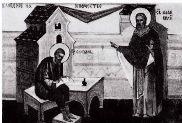
Благословение на иночество

неделю. Родные и односельчане, узнав, что он собирается на Святую гору, в душевной радости собрали холсты и много других вещей на монастырскую потребу. Русский народ во все времена благоговейно относился к монастырям, а особенно к Святой горе Афонской. Не всегда владея книжной мудростью, народ молитвенно помнил, что монашество началось в России именно с посланника Афонского преподобного Антония. Душой знает Рос-