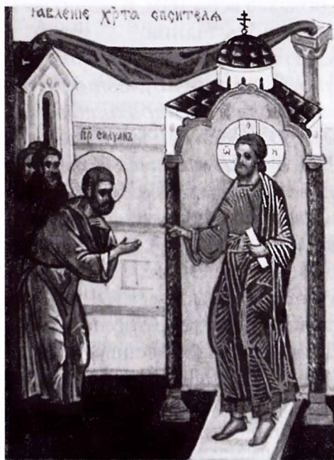
Явление Христа Спасителя

ния, но ясно видится в душе вечная погибель. И ощутил я в душе, что Бог немилосерд и неумолим. Продолжалось это со мною час или немного более. Дух этот такой тяжёлый и томительный, что страшно о нем и вспоминать. Душа не в силах понести его долго. В эти минуты можно погибнуть на всю вечность. Попустил Милостивый Господь духу злобы сделать такую брань с моею душою. Прошло мало времени; я пошел в церковь на вечерню и, глядя на икону Спасителя, сказал: «Господи Иисусе Христе, помилуй мя, грешного». И с этими словами увидел на месте иконы живого Господа, и благодать Святого Духа наполнила душу мою и все тело. И так я Духом Святым познал, что Иисус Христос есть Бог; и я сладко желал страданий за Христа». «Одни грехи принес я в монастырь, и не знаю за что Господь даровал мне, когда я был