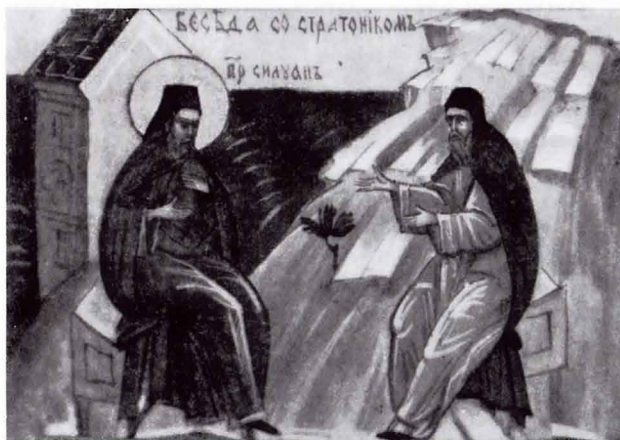
Беседа пр. Силуана с монахом

Многие из насельников горы Афонской из разных монастырей приходили к отцу Силуану побеседовать с ним о монашеском делании, о богомыслии. Любили говорить с ним и высокообразованные люди. Когда им говорили, что отец Силуан неграмотный, и как же можно с ним говорить, они отвечали, что «для того чтобы говорить с ним, нужно быть профессором», или, что «он стяжал исключительную духовную мудрость». Он обладал даром сказать