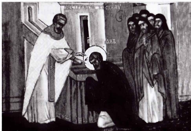
пострижение в схиму

Через четыре года после поступления в обитель, в 1896 году он был пострижен в мантию с именем Силуан. А в 1911 году был пострижен в великую схиму. Все годы жизни в монастыре, вплоть до самой кончины, преподобный Силуан подражал в смирении и других духовных подвигах преподобным отцам Афона. Бог даровал ему за смирение узнать Свою любовь. И эта любовь так наполнила Силуана, что он в избытке изливал