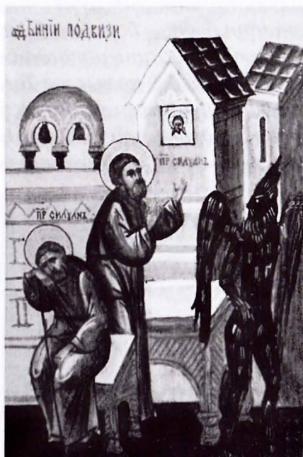
Искушение во время молитвы

Однажды ночью, во время келейной молитвы, он встал с табурета, чтобы поклониться иконам и увидел беса, вставшего между ним и иконами и ждавшего, чтобы Силуан поклонился ему. Преподобный сел на место и снова погрузился в молитву. «И я недоумевал, что со мною делается: душа моя знает Господа и Его любовь; как же мне приходят плохие мысли». «Господи, Ты видишь, что я хочу молиться Тебе чистым умом, но бесы не дают мне. Научи меня, что должен я делать, чтобы они не мешали мне?»